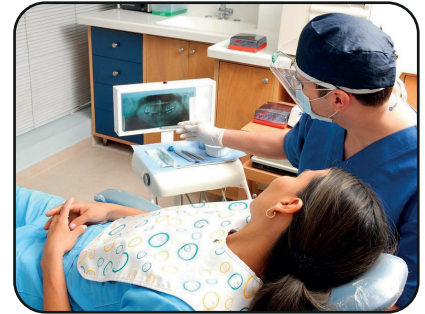
Discusión de instrucciones post-operatorias

Para controlar el malestar , tome el medicamento para dolor antes de que la anestesia se haya ido o según lo recomendado.